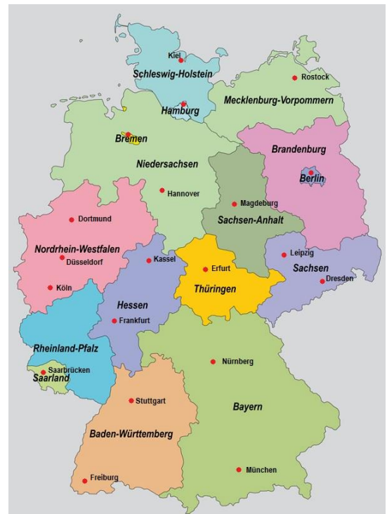
19 Lager von Paperworld-Hamburg in Deutschland